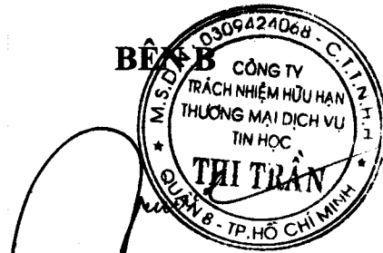
Thi Tân Luật

Thỏa thuận khung này được làm thành 06 (sáu) bản có nội dung và giá trị pháp lý như nhau: Bên A giữ 04 (bốn) bản, Bên B mỗi bên giữ 02 (hai) bản. /